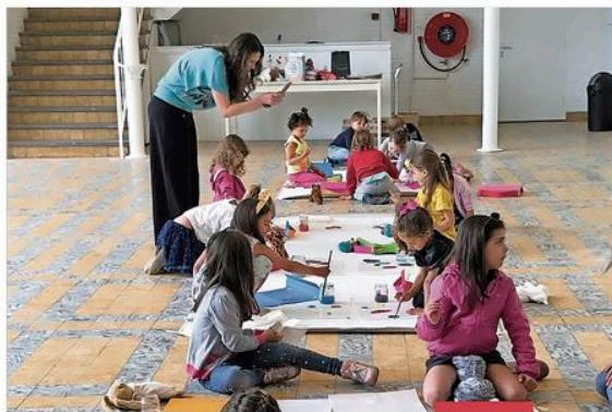
■ De kinderen gaan enthousiast aan de slag met de opdrachten.

"Aandacht besteden aan de creativiteit van kinderen draagt bij aan hun ontwikkeling. Kunst is niet alleen een veilige manier om emoties te uiten, maar ook om kennis te maken met het onbekende. Bovendien stimuleert het oplossingsgericht denken", zo vertelt de kunstenaar. Ze vervolgt: "De Aula van Ateliers 2005 is uitermate geschikt om jongere kinderen op een veilige manier les te geven. Ze ervaren er de sfeer van het atelier en mijn creatieve proces. Met andere woorden: ze krijgen een kijkje in mijn kunstenaarskeuken in een gemeentelijk gebouw met historische waarde, en mogen zelf nog wat koken ook!" De schilderess voegt hier aan toe: "De aankomende generaties krijgen te maken met nog snellere ontwikkelingen. Zij moeten in staat zijn om zich goed uit te drukken en zich aan te passen om deze ontwikkelingen